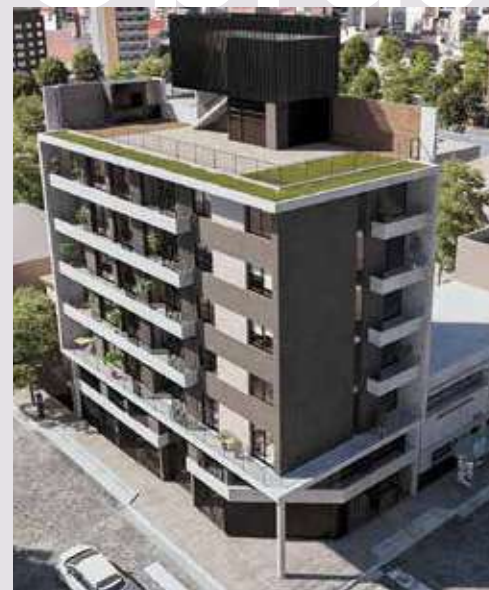
COLUMBIA Colón esq. Cochabamba. Rosario.