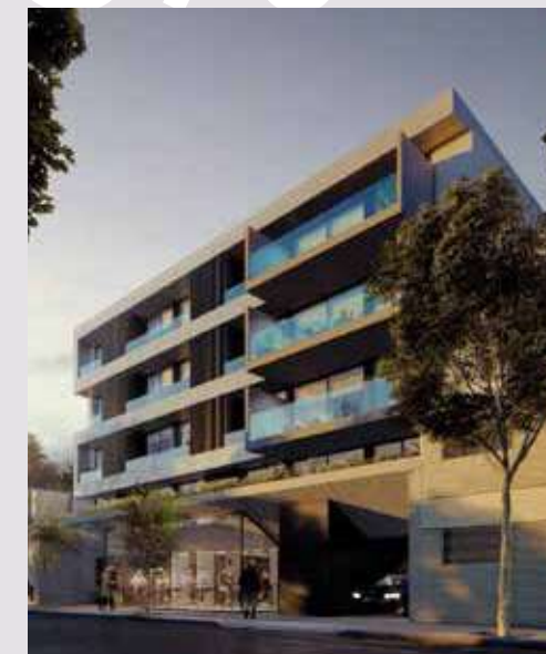
LIVINGGREEN Güemes 2472. Rosario.