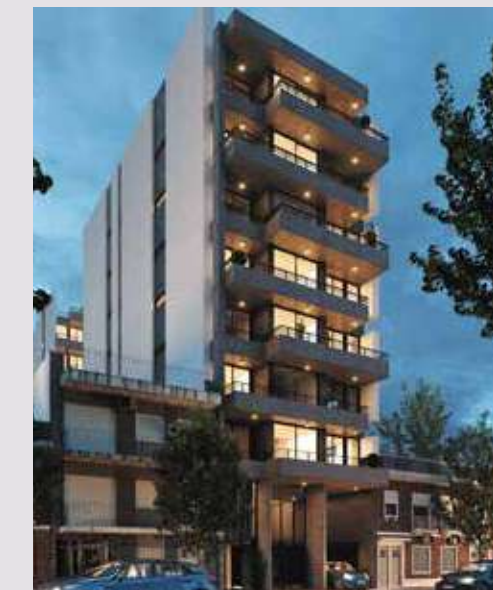
CONQUEROR JM de Rosas 1630. Rosario.