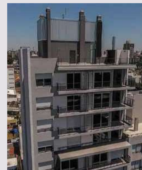
CONDO NELLO II Alem 2450. Rosario.