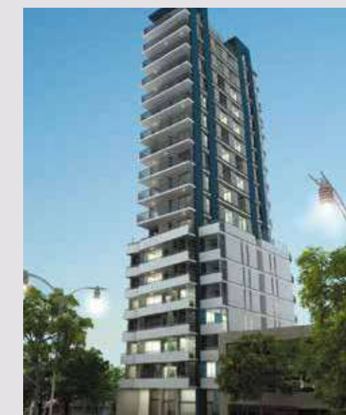
360 BUILDING Bv. Urquiza 571. San Lorenzo.