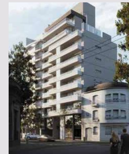
CITTÁ LUX Tucumán 2126. Rosario.