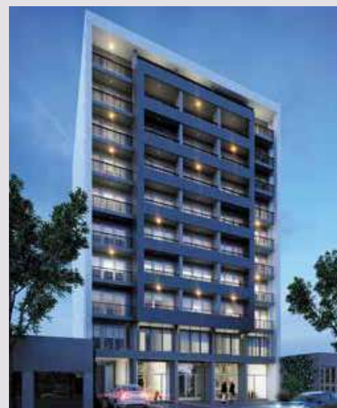
WE BUILDING Av. Pellegrini 4041. Rosario.