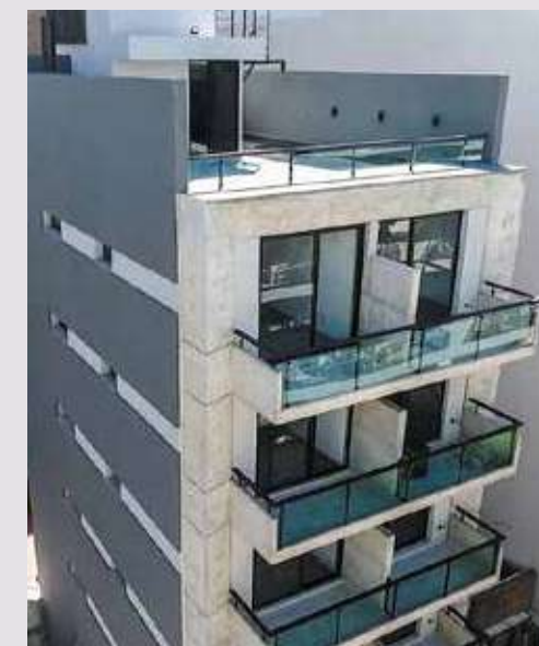
SINGLE Brown 1790. Rosario.