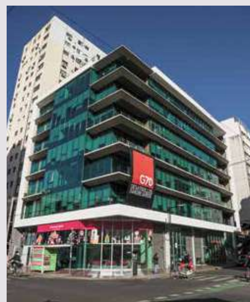
FOSS II Corrientes esq. San Lorenzo. Rosario.